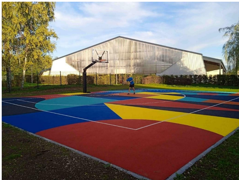
Photo : Terrain 3X3 inauguré le 26 octobre 2022 à Ferney-Voltaire

Le Plan 5 000 Equipements , fort à la première édition (initialement destiné aux zones QPV et ZRR) ayant permis de soutenir la construction de plus de 2 000 terrains de sport de proximité (dont celui de Ferney-Voltaire en photo ci-dessous), est désormais accessible pour l'ensemble du territoire National .